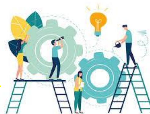
Actividades de movilidad +...