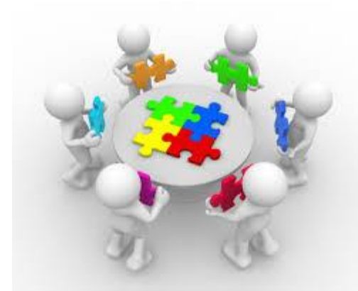
Implementación y cambios en nuestra realidad