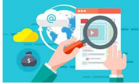
Análisis de la realidad