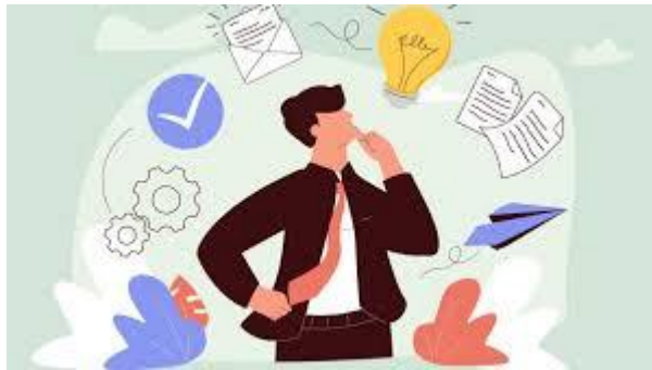
Necesidades y retos