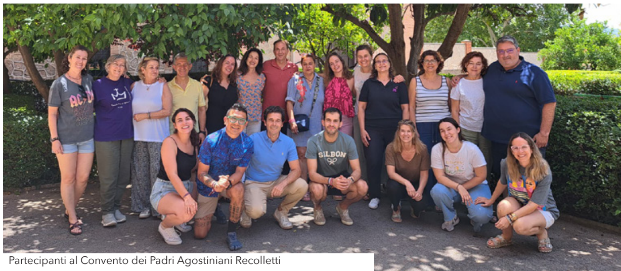
Partecipanti al Convento dei Padri Agostiniani Recolletti

Infine, sono previsti altri tre incontri per tutti i Maristi di Champagnat della nostra Provincia: dal Libano, passando per Assisi in Italia, fino a Fuenteheridos nei pressi di Huelva: fratelli, laici e famiglie hanno l'opportunità di fermarsi e prendersi il tempo per ricaricarsi di ciò che è veramente importante, prima di iniziare il nuovo anno scolastico a settembre.