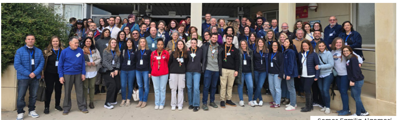
Somos Familia Algemés

Gracias a todos y a todas las que habéis querido reforzar y celebrar vuestra vida marista con estos momentos. ¡Nos seguimos encontrando en el camino!